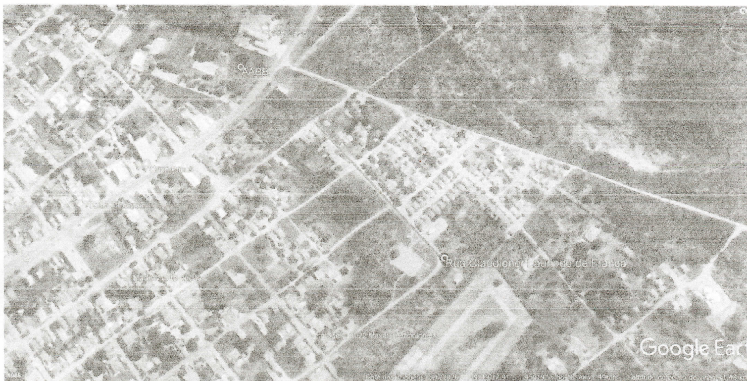
Gilbués-PI – Imagem aérea (Maio, 2022)